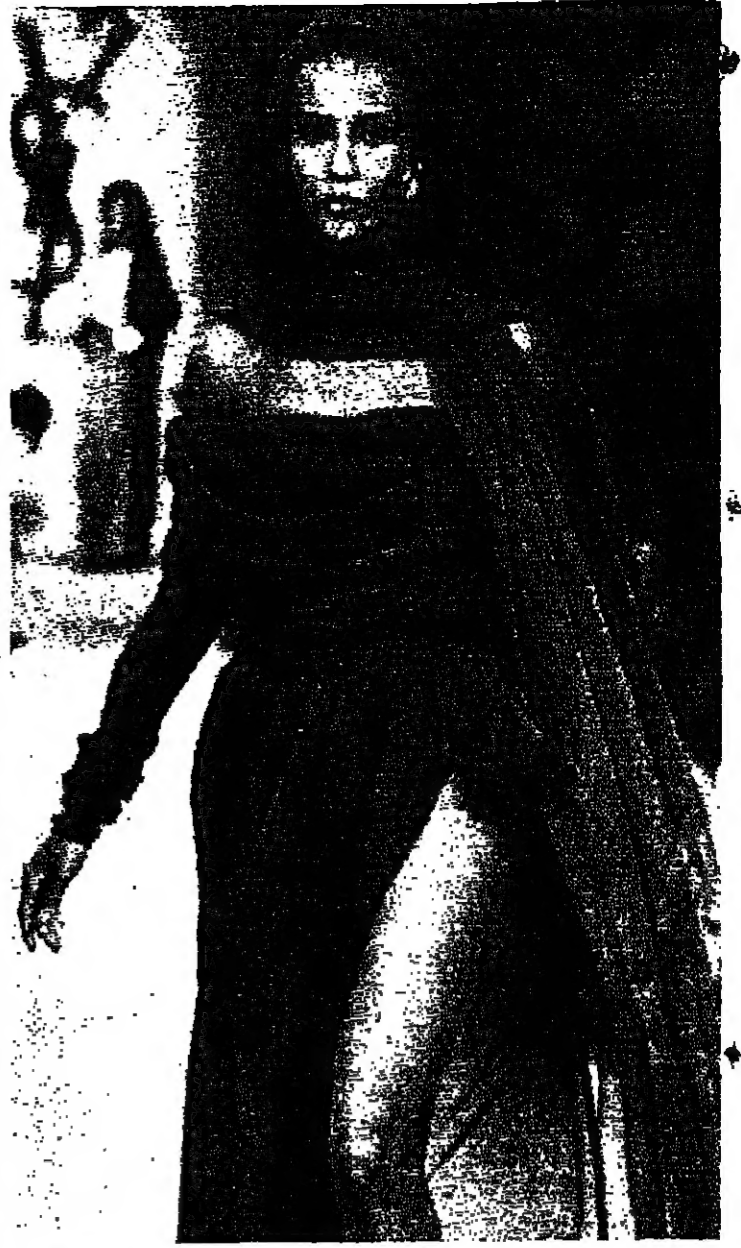
تجاوزت مخلبة مصممي الازياء حدود رؤية الناس العاديين لتصل الى موبيلات قد لا تخظر على بال احد . واحد المصممين البارسيين الشهيرين لم يتكف هذه المرة بباراز موهبته كمصمم بل راح يبحث عن جسد يليق بتخله . فكانت هذه العارضة المعبرة التي جاء بها من الصومال . وكان هذا الثوب البكر من الشيفون . باريس - ر